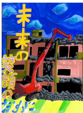
【令和2年度最優秀作品】