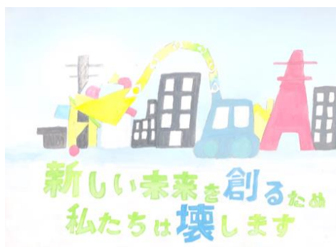
【令和2年度優秀作品】